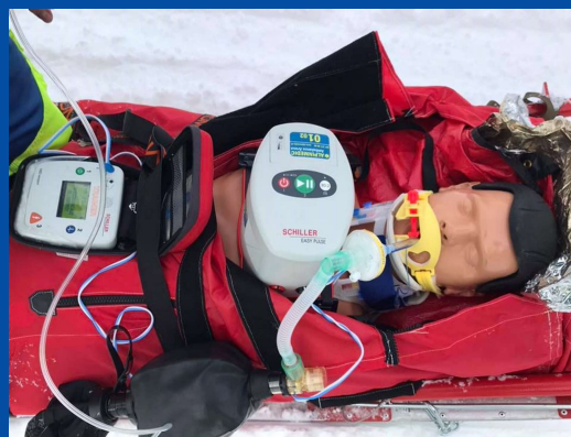
Schiller Easy Puls